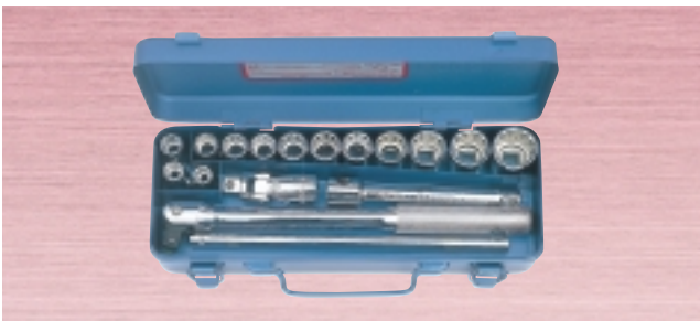
N 1750M ・ソケット 13サイズ 17点セット