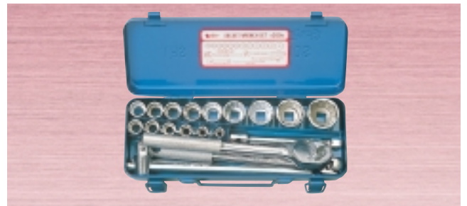
N 260M ・ソケット 15サイズ 20点セット