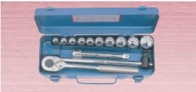
N 800M・880M ・ソケット 10サイズ 13点セット