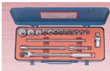
N 317M ・ソケット 12サイズ 17点セット