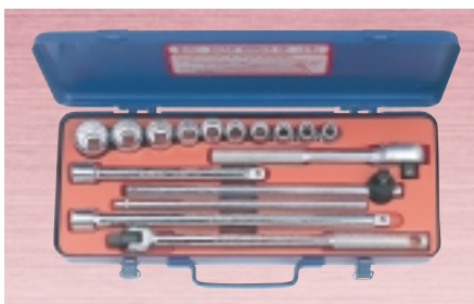
N 316M・316J ・ソケット 10サイズ 15点セット