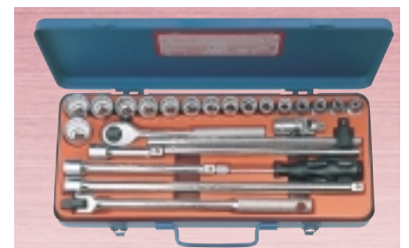
N 325M ・ソケット 16サイズ 25点セット