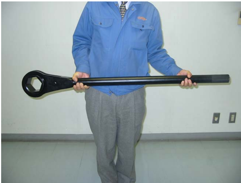
Ref. Model: RH80T

和一般常用尺寸 10mm 到 46mm 的棘轮扳手不同，大型 RH 系列适用于船舶，造船，成套设备的热交换器的制造，操作和维修。适用于大型建筑，基本建设和其他重工业。