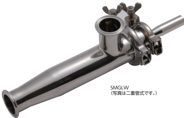
SMGLW (写真は二重管式です。)