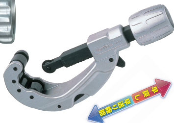
TC205(面取用ナイフ・スペアー用替刃付)