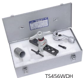
TS456WDH (手動・電動兼用型)