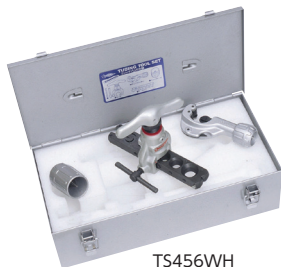
TS456WH (フィードハンドル型)