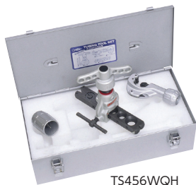
TS456WQH (クイックハンドル型)PAT.