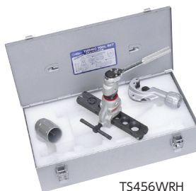
TS456WRH (ラチェットハンドル型)