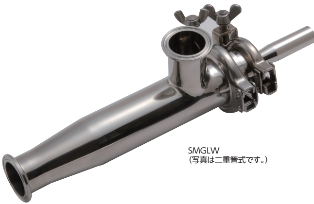
SMGLW (写真は二重管式です。)