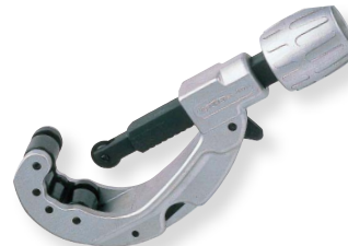
TC205 (面取用ナイフ・スパー用替刃付)