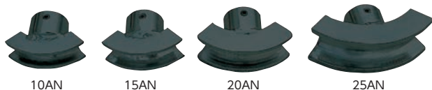
10AN 15AN 20AN 25AN