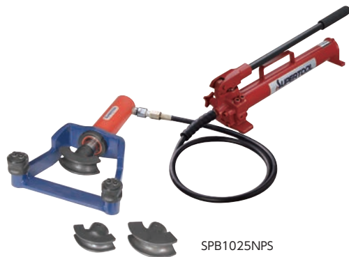
■90度バンド ■立ち上げバンド ■オフセットバンド