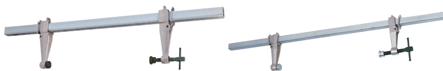
ストロングタイプ (角パイプ: □40×1m) (FCW410~420)